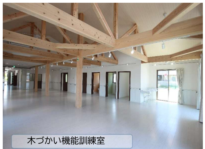
木づかい機能訓練室