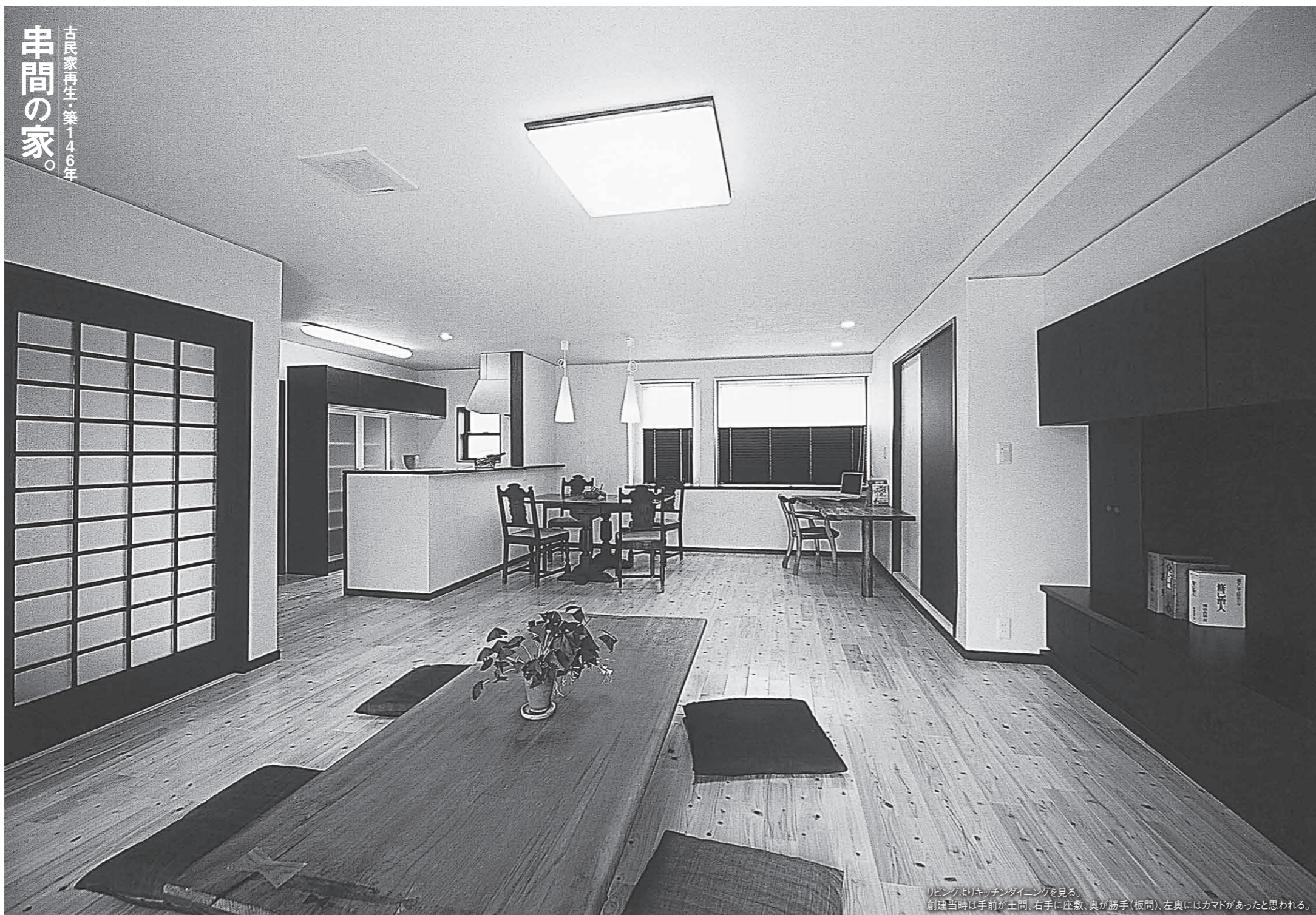
古民家再生・築146年 串間の家。

営業案内・設計施工 ■住宅・新築・増改築・リフォーム・家具・収納・建具システムキッチン ■古民家再生・保存・移築 ■ハイブリッドソーラーハウス・及び太陽光発電 ■商店・医院建築など